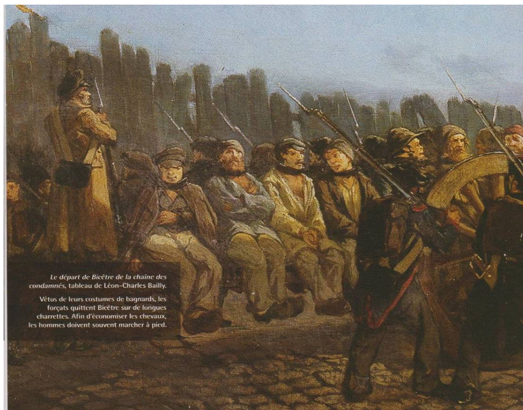
Le départ de Bicêtre de la chaîne des condamnés, tableau de Léon-Charles Bailly. Vêtus de leurs costumes de bagnards, les forçats quittent Bicêtre sur de longues charrettes. Afin d'économiser les chevaux, les hommes doivent souvent marcher à pied.