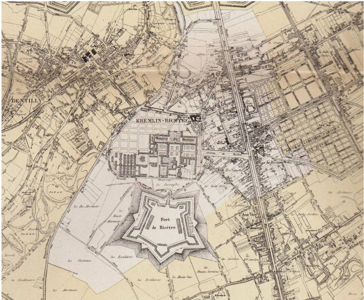
Image 5 : Le Kremlin-Bicêtre en 1898 – Emplacement actuel de la place de la mairie